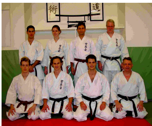
Ungewissheit vor der Prüfung

Acht Karatekas der Karateschule Ku Shi Kai haben am 4. Dezember 2004 erfolgreich die Dan Prüfung absolviert. Doch bis es so weit war, mussten viele intensive Trainingseinheiten absolviert werden. Anfangs 2004 wurde die Saisonplanung vollumfänglich auf die Dan Prüfung im Dezember ausgerichtet.