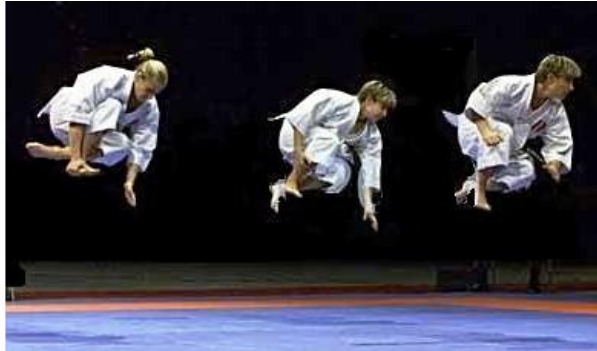
Teamkata erfordert höchste Synchronität

Qualifizierung für die Schweizer Nationalmannschaft dient. Karatekas, die an diesen Turnieren gut abschneiden, können sich Chancen ausrechnen, für die Nationalmannschaft berücksichtigt zu werden