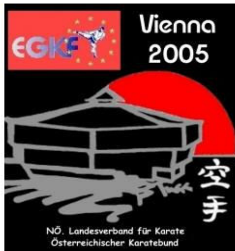
Goju-Ryu Europa-Meisterschaft in Wien

Zwölfte Goju-Ryu Europa-Meisterschaft wieder mit Zuger Beteiligung?